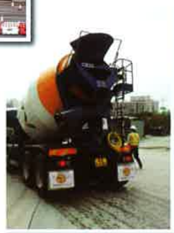
在建造業車輛的尾輔檔套上展示宣傳標示