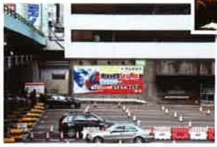
在紅磡隧道口登抗毒駕廣告