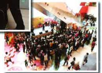
在商場舉行大型宣傳抗毒駕活動