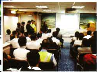
與機管局合作向機場內工作的司機舉行講座