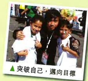
▲ 突破自己，邁向目標

參加無家者世界盃，除了能夠擴闊眼光外，更得到別人的尊重。無論過去經歷如何，只要身穿國家代表球衣，身分就只有「球員」一個。然後再透過足球運動和各國參加者交流及互相鼓勵。比賽過後，我靠著從比賽過程中所學習的點滴計劃人生，尋找新目標。現在，我快將完成社工課程，正式成為一名註冊社工。我希望可以用自己的經歷去幫助人，更希望未來有更多人能夠從足球比賽中找回自己的生命及價值，而我就是靠足球而改變過來的。