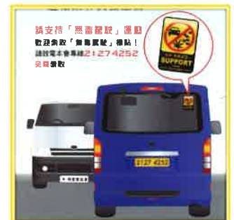
本會設計了一款無毒駕駛標貼，讓司機貼在汽車的擋風玻璃上，以表支持是項運動