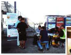
到葵涌貨櫃碼頭向貨櫃車司機推廣抗毒駕訊息及展覽