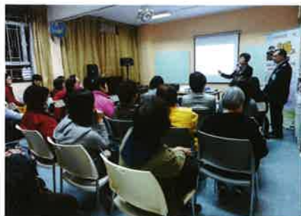
▲ 互累症家人講座情況