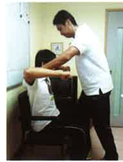
為有毒駕問題的司機進行身體評估