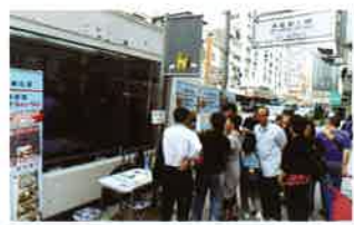
透過流動宣傳車推廣抗毒駕服務